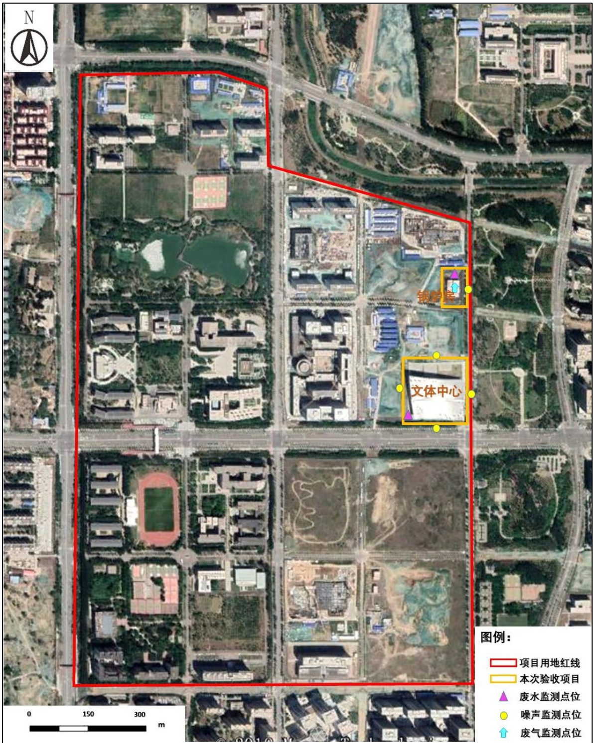
图 3-2 北京理工大学良乡校区总平面图及监测点位