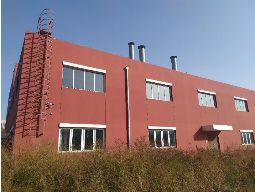
图 3-10 锅炉房外观（二）