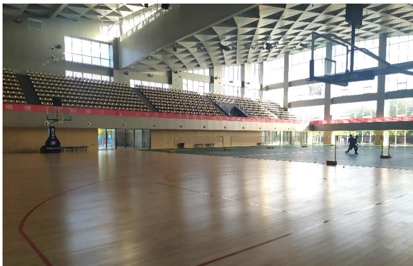
图3-5 文体中心篮球馆