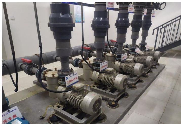
图 4-6 地下水泵房