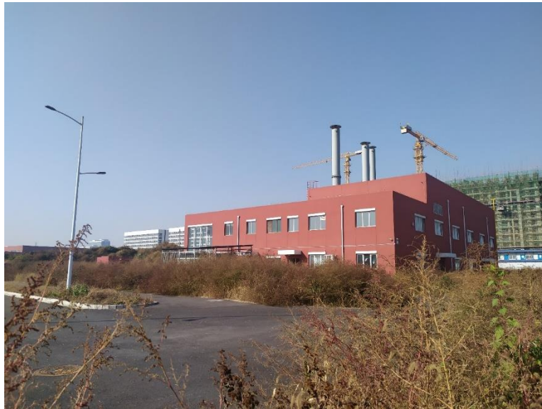
图4-1 锅炉房及排气筒