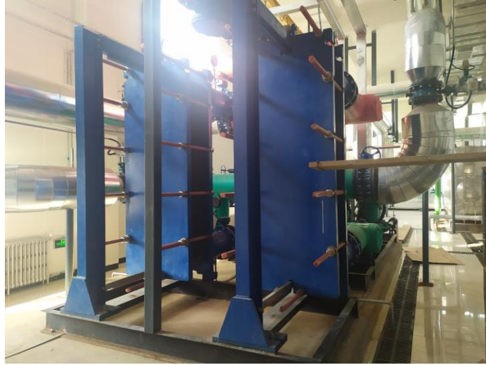
图 4-4 室内换热机组