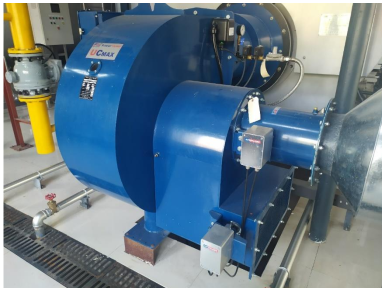
图4-2 锅炉低氮燃烧器