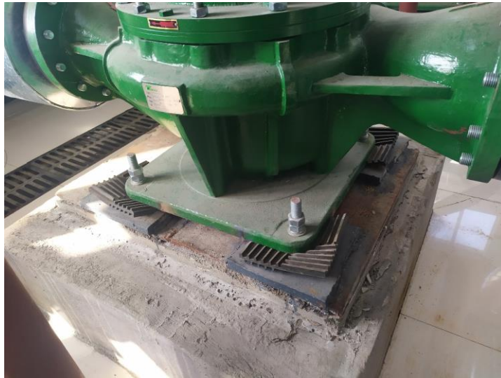
图 4-5 水泵减震基础