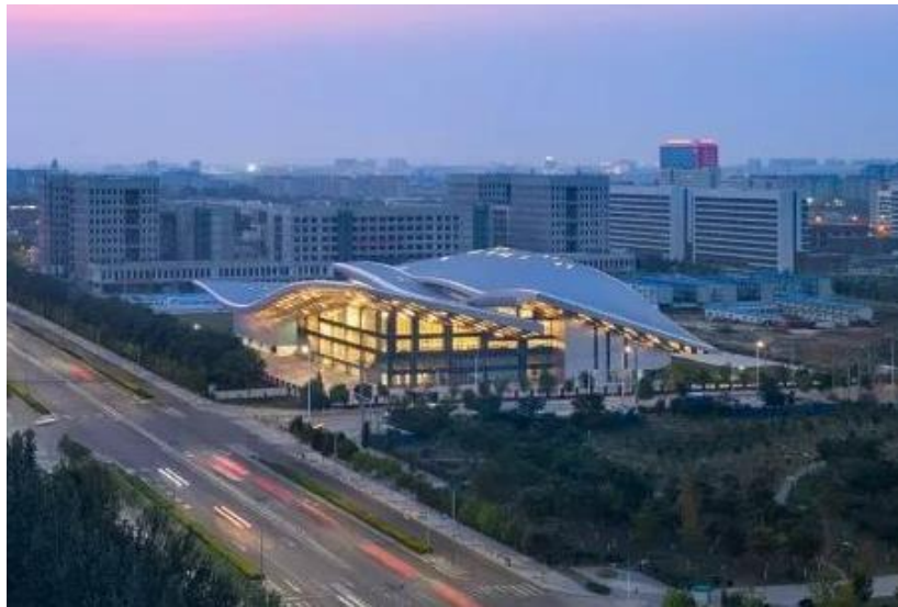
图3-4 文体中心鸟瞰图