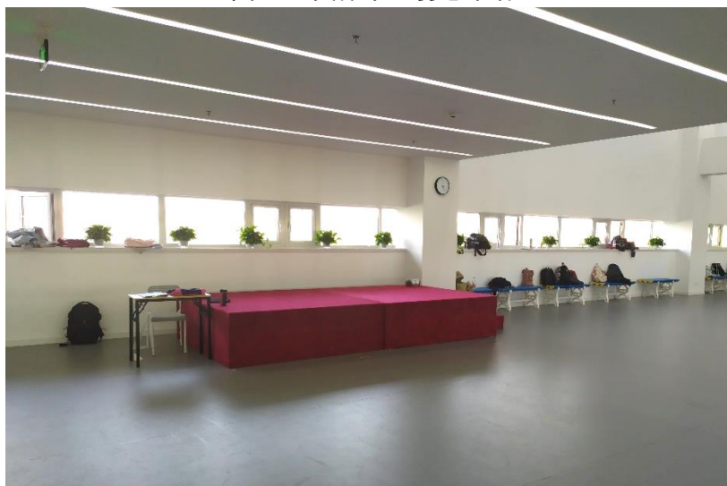
图 3-8 文体中心艺术体操室