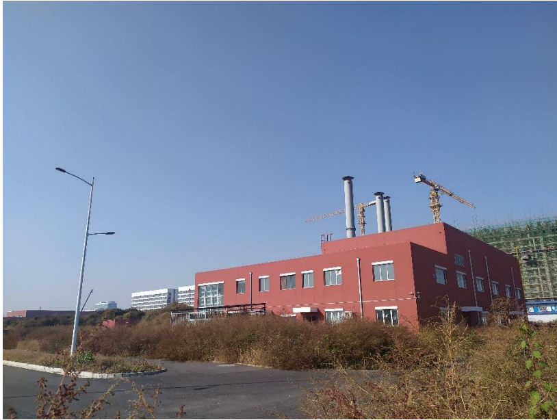
图 3-9 锅炉房外观（一）