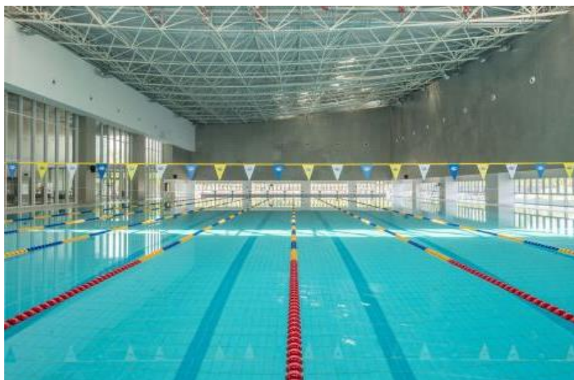
图 3-6 文体中心游泳馆