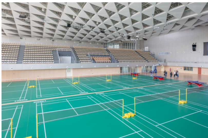
图 3-7 文体中心羽毛球馆